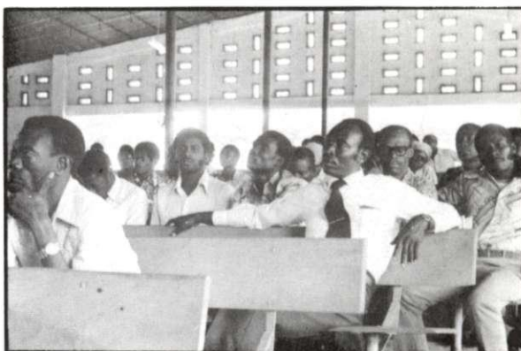
Une partie des participants, au Tabernacle de Frères (Haiti).