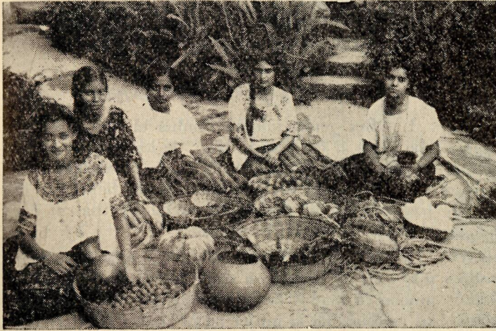
Arriba: —Un grupo de señoritas cristianas dando tratados a unos vendedores que afanosamente hacen escobas. A la izquierda: —Un simpático y pintoresco grupo de vendedoras ambulantes.