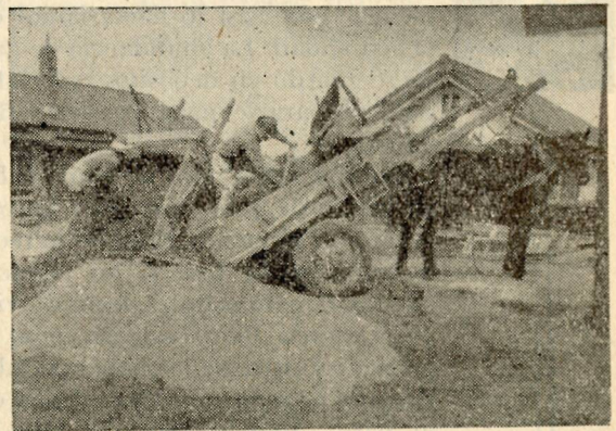
Construyendo una Iglesia en Japón