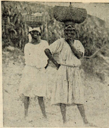
Mujeres haitianas cargando su comida de la manera acostumbrada en su país.

Hasta en tanto que nosotros podamos dominar el francés y el creol y podamos traducir todas las lecciones del Curso Uniforme, tendremos que seguir dependiendo en gran parte en el método de educación visual, mediante el cual mi esposa ha podido presentar muchas historias bíblicas a la gente. Para muchas personas esta será la única manera de aprender algo acerca de la Biblia. El Evangelio de Lucas es el único que está traducido en una buena versión en el creol , los otros tres evangelios están traducidos y disponibles aun cuando la traducción es muy defectuosa, y el resto de la Biblia todavía no ha sido traducida al idioma de los haitianos. Esperamos pronto cimentar el trabajo de nuestras es-